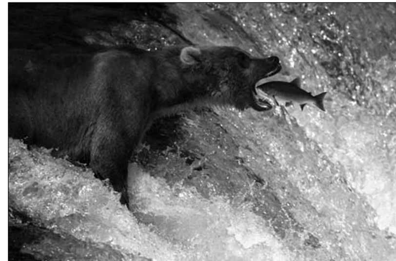
Die Mensen des Studentenwerks – leider nur selten vegan.

Nicht zu vergessen ist aber auch das studentische Café Tatort an unserem Fachbereich. Dort gibt es neben dem günstigen und ökologischen Kaffee für 30 Cent eine große Auswahl an Leckereien und viele verschiedene Tees. Das Café Tatort befindet sich im Anbau zwischen Van't-Hoff-Straße und Boltzmannstraße.