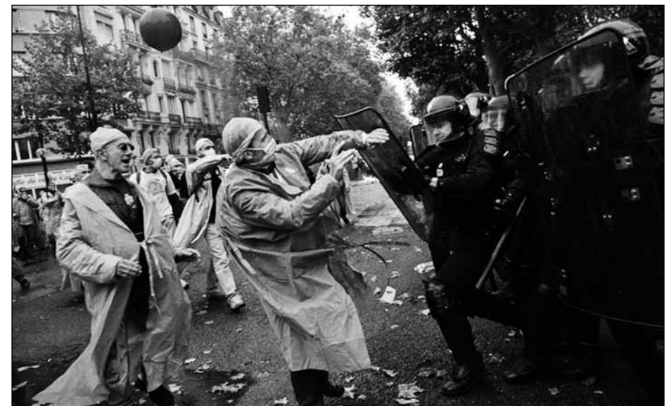
Selbst die Mediziner wissen sich zu wehren...

Noch kann der Prozess jedoch beeinflusst werden! Eine Info – und Diskussionsveranstaltung zu den geplanten Änderungen soll es am Anfang des Wintersemesters geben. Achtet auf Ankündigungen und Aushänge!