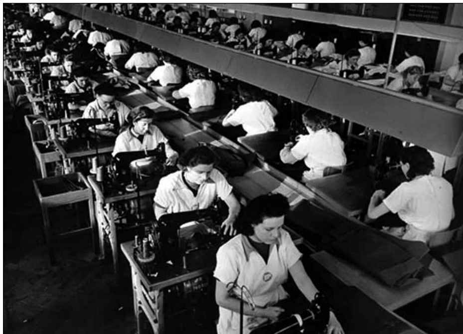
Dein erstes Semester.

Bürgerliches Recht ist das Recht der Privatleute untereinander, und zwar im wesentlichen Vertragsrecht. Das wird jedenfalls für dich zunächst am wichtigsten sein. Im ersten Semester geht es vor allem um die Frage, wie ein wirksamer Vertrag zustande kommt. Dabei kann es eine Rolle spielen, ob sich die Parteien überhaupt verpflichten wollten, ob ihre Erklärungen übereinstimmen oder ob Minderjährige oder StellvertreterInnen beteiligt waren.